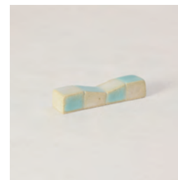
ubu_i-06 市松箸置 ichimatsu- Chopstick rest

益子青磁釉 /Mashiko Seladon w21 × d12.5 × h1.5 ¥3600 (+tax)