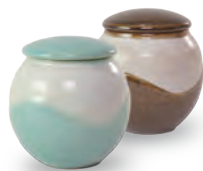
ubu-08 シュガーポット Sugar pot

益子青磁釉 / 飴釉 Mashiko Seladon / Caramel w10 × d6.5 × h6.5cm ¥2300+tax