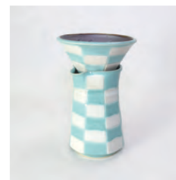
ubu_i-03 市松ドリッパーセット ichimatsu-Dripper set

益子青磁釉 /Mashiko Seladon D : φ13 × h8.5 S : φ9.5 × h15 ¥9000 (+tax)