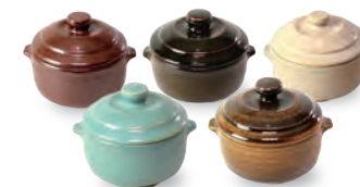
ubu-15 デザートポット Dessert pot

益子青磁釉 / 飴釉 Mashiko Seladon / Caramel Φ11.5 × h6cm ¥2500+tax