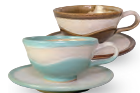
ubu-05 ティー C&S Tea C&S 益子青磁釉 / 飴釉 Mashiko Seladon / Caramel c w14.5 × d11 × h7 s Φ 15.5 × h2.5cm ¥4000+tax