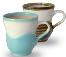
ubu-02 マグカップ Mug cup 益子青磁釉 / 飴釉 Mashiko Seladon / Caramel w11.5 × d8 × h9.5cm ¥3000+tax