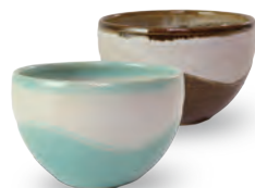
ubu-13 ボウル Bowl

益子青磁釉 / 飴釉 Mashiko Seladon / Caramel Φ4.5 × h7.5cm ¥1400+tax