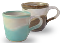
ubu-07 デミタスカップ Demitas Cup

益子青磁釉 / 飴釉 Mashiko Seladon / Caramel w10 × d6.5 × h6.5cm ¥2300+tax