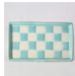
ubu_i-05 市松長方皿 ichimatsu- Rectangular plate

益子青磁釉 /Mashiko Seladon φ14.5 × h1.5 ¥3400 (+tax)