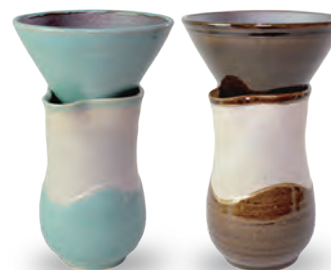
ubu-21 ドリッパーセット・シンプルタイプ Dripper set • simple type

益子青磁釉 / 飴釉 Mashiko Seladon / Caramel d Φ 12.5 × h8.5 s w9 × d 8 × h 15.5cm ¥7000+tax *セット販売のみです。