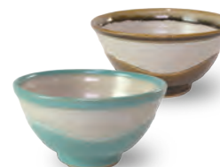
ubu-14 飯碗 Rice bowl

益子青磁釉 / 飴釉 Mashiko Seladon / Caramel Φ9 × h9cm ¥2500+tax