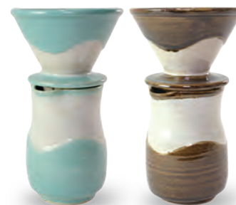
ubu-04-1 / 04-2 / 04-3 ドリッパー (L/S) & サーバー Dripper(L/S) & server

益子青磁釉 / 飴釉 Mashiko Seladon / Caramel d (L) Φ 12.5 × h9.5 ¥3800+tax (S) Φ 11.5 × h8.5 ¥3500+tax s Φ 8.5 × h13.5cm ¥3800+tax