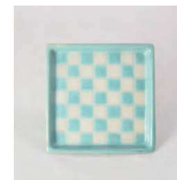
ubu_i-04 市松スクエア皿 ichimatsu-Square plate

益子青磁釉 /Mashiko Seladon φ14.5 × h1.5 ¥3400 (+tax)