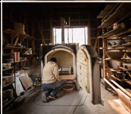
仕事場の風景 (益子町) Scenery of Atelier (Mashiko town)