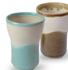
ubu-16 フリーカップ (曲) Freecup A

益子青磁釉 / 飴釉 Mashiko Seladon / Caramel Φ10.5 × h6.5cm ¥2500+tax