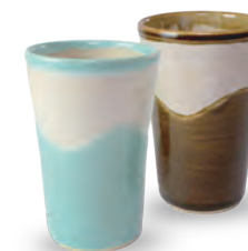
ubu-17 フリーカップ (直) Freecup B

益子青磁釉 / 飴釉 Mashiko Seladon / Caramel Φ8 × h11cm ¥2700+tax