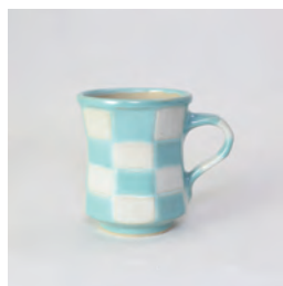
ubu_i-01 市松マグカップ ichimatsu-MugCup

益子青磁釉 /Mashiko Seladon w11 × d8.5 × h10 ¥3800 (+tax)