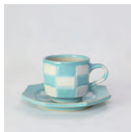
ubu_i-02 市松 C&S ichimatsu-C&S

益子青磁釉 /Mashiko Seladon w11 × d8.5 × h10 ¥3800 (+tax)