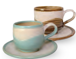
ubu-03 コーヒー C&S Coffee C&S 益子青磁釉 / 飴釉 Mashiko Seladon / Caramel c w11 × d7.5 × h7.5 s Φ 14.5 × h2cm ¥3800+tax