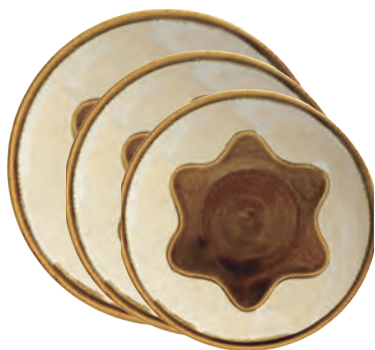
ubu-10 / ubu-11 / ubu-12 8・7・6寸皿 Dish (L・M・S)

益子青磁釉 / 飴釉 Mashiko Seladon / Caramel L Φ24.5 × h4 / M Φ21.5 × h3 / S Φ18.5 × h2.5cm ¥3800+tax ¥3000+tax ¥2500+tax