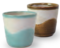
ubu-01 カップ Cup 益子青磁釉 / 飴釉 Mashiko Seladon / Caramel Φ 7.5 × H7.5cm ¥2000+tax