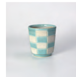
ubu_i-07 市松湯呑 ichimatsu-Cup

益子青磁釉 /Mashiko Seladon w7 × d1.7 × h1.5 ¥800 (+tax)