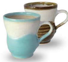
ubu-02 マグカップ Mug cup 益子青磁釉 / 飴釉 Mashiko Seladon / Caramel w11.5 × d8 × h9.5cm ¥2700+tax