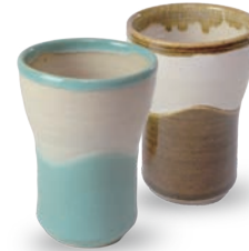
ubu-16 フリーカップ (曲) Freecup A

益子青磁釉 / 飴釉 Mashiko Seladon / Caramel Φ10.5 × h6.5cm ¥2500+tax