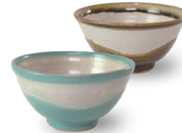
ubu-14 飯碗 Rice bowl

益子青磁釉 / 飴釉 Mashiko Seladon / Caramel Φ9 × h9cm ¥2400+tax