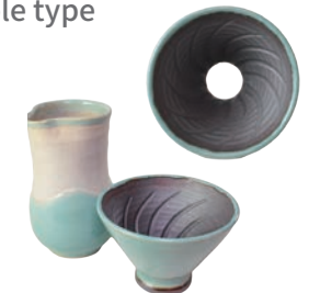
益子青磁釉 / 飴釉 Mashiko Seladon / Caramel d φ 12.5 × h8.5 s w9 × d 8 × h 15.5cm ¥6000+tax *セット販売のみです。