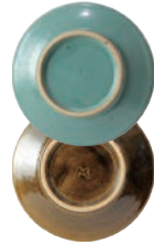
ubu-05 ティー C&S Tea C&S 益子青磁釉 / 飴釉 Mashiko Seladon / Caramel c w14.5 × d11 × h7 s φ 15.5 × h2.5cm ¥3700+tax