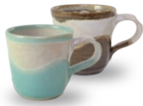
ubu-07 デミタスカップ Demitas Cup

益子青磁釉 / 飴釉 Mashiko Seladon / Caramel w10 × d6.5 × h6.5cm ¥2000+tax