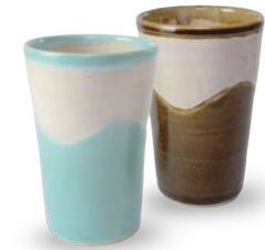
ubu-17 フリーカップ (直) Freecup B

益子青磁釉 / 飴釉 Mashiko Seladon / Caramel Φ8 × h11cm ¥2500+tax