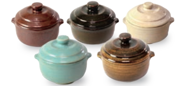
ubu-15 デザートポット Dessert pot

益子青磁釉 / 飴釉 Mashiko Seladon / Caramel Φ11.5 × h6cm ¥2300+tax