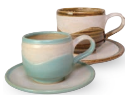
ubu-03 コーヒー C&S Coffee C&S 益子青磁釉 / 飴釉 Mashiko Seladon / Caramel c w11 × d7.5 × h7.5 s φ 14.5 × h2cm ¥3500+tax