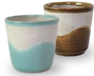
ubu-01 カップ Cup 益子青磁釉 / 飴釉 Mashiko Seladon / Caramel φ 7.5 × H7.5cm ¥1800+tax