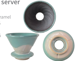
益子青磁釉 / 飴釉 Mashiko Seladon / Caramel d (L) φ 12.5 × h9.5 ¥3500+tax (S) φ 11.5 × h8.5 ¥3200+tax s φ 8.5 × h13.5cm ¥3500+tax