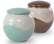
ubu-08 シュガーポット Sugar pot

益子青磁釉 / 飴釉 Mashiko Seladon / Caramel w10 × d6.5 × h6.5cm ¥2000+tax