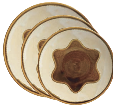
ubu-10 / ubu-11 / ubu-12 8・7・6寸皿 Dish (L・M・S)

益子青磁釉 / 飴釉 Mashiko Seladon / Caramel L Φ24.5 × h4 / M Φ21.5 × h3 / S Φ18.5 × h2.5cm ¥3500+tax ¥2800+tax ¥2300+tax