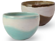
ubu-13 ボウル Bowl

益子青磁釉 / 飴釉 Mashiko Seladon / Caramel Φ4.5 × h7.5cm ¥1400+tax