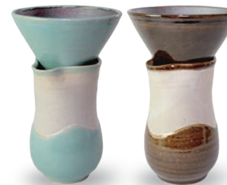
ubu-21 ドリッパーセット・シンプルタイプ Dripper set・simple type