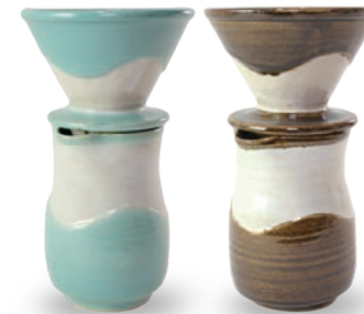
ubu-04-1 / 04-2 / 04-3 ドリッパー (L/S) & サーバー Dripper(L/S) & server